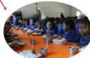
** AMBINANINDRANO * 538 enfants

700 000 repas par an, 3600 enfants nourris, 4000 scolarisés, 4700 bénéficiaires de la spiruline