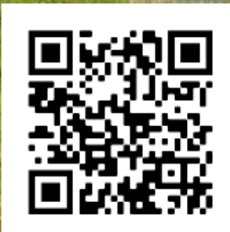
Le site internet