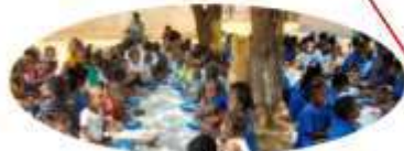
** BEKOPAKA * 187 enfants