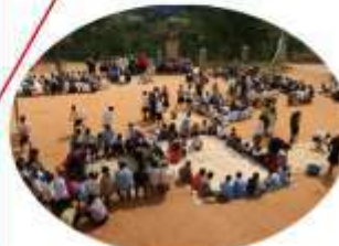
** IMITO 945 enfants