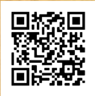
La galerie YouTube