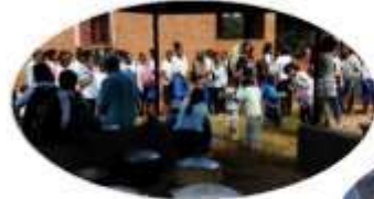
** ANTSONGO * 1177 enfants