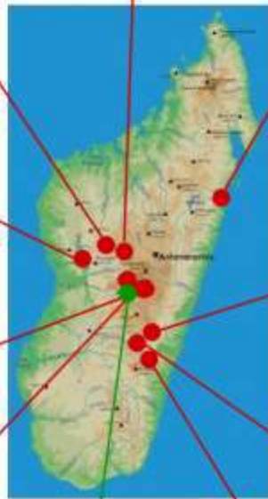
Ferme de spiruline FANANTENANA 4 600 bénéficiaires (avec d'autres associations)