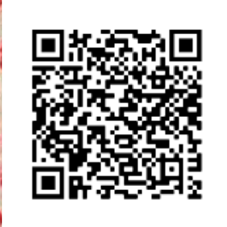
Don en ligne