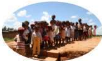
TSIROANOMANDIDY 82 enfants