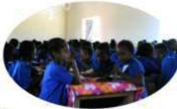
** MAHAMBO * 411 enfants