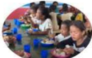
ANKADINONDY-SAKAY * 80 enfants