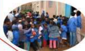
** IMADY 744 enfants